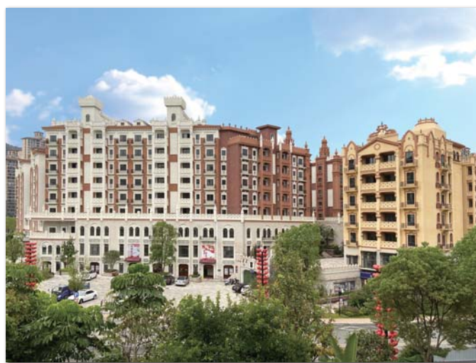
梅州客天下 / 1,000,000 m 2