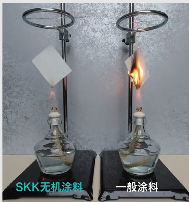
※SKK无机涂料燃烧试验

无机涂料是以无机矿物质，无机粉体等为主要原料，我司始终以技术创新为己任，将大自然赋予「无机素材」的不燃功能发挥到最大化。