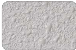
小粒喷涂 Small Mount Finish