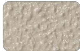
桔皮状滚涂 Roller Tile Finish